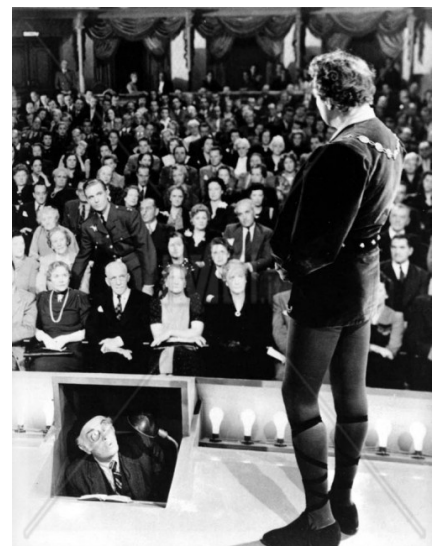
To be or not to be