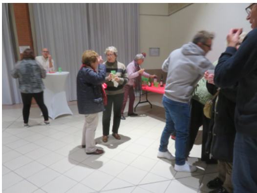
Le brunch décontracté et sympathique

Le deuxième film, Evolution , de Kornél Mundruczó (2022) a présenté 3 époques d'une famille juive d'Auschwitz à Berlin. Cette projection a permis de compléter la présentation de deux autres films de ce réalisateur, lors de saisons précédentes.