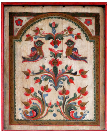
Le panneau avec les oiseaux

Le panneau central du parapet représente deux calices, preuve du symbolisme du calice de la Réforme.