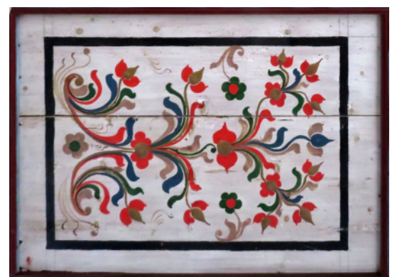
L'un des 15 caissons du plafond

Les panneaux de la balustrade ont probablement été réalisés par János Gyarmati de Vajszló. Les autres panneaux sont décorés de fleurs, un seul d'entre eux montre deux oiseaux face à face aux plumes stylisées à décor de fleurs.