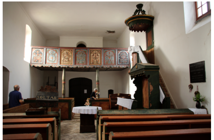
Les 7 panneaux du parapet

L'église réformée de Kovácsbida (à 30 km au sud de Pécs) est l'une des plus belles de cette région.