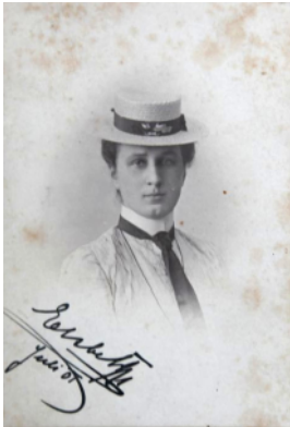
Mère de Gitta

Margit Eugénia, dite Gitta Mallász, naît le 21 juin 1907 dans une famille noble, sa mère est autrichienne et son père colonel dans l'armée hongroise.